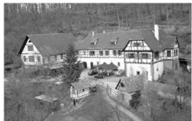
Jugendhof Seehaus von Prisma e.V

Initiative für Jugendhilfe und Kriminalprävention e.V.